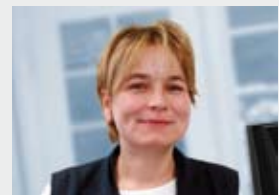
Cornelia Huber Webpublishing